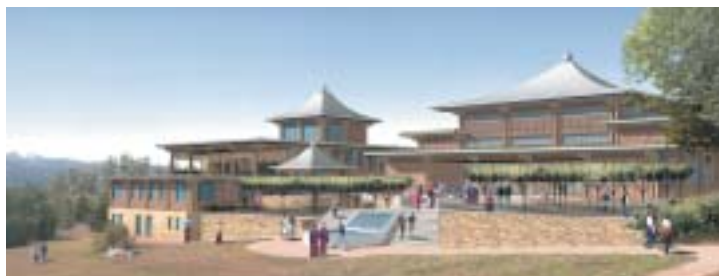
Projet d'institut de bouddhisme tibétain

Le bâtiment a été conçu par un architecte allemand, Wilfried Kröger. Son esprit général est celui d'une architecture écologique, à la fois dans le choix de ses matériaux naturels et non polluants, mais aussi dans son usage (capteurs solaires, limitation des rejets d'eaux pluviales aux égouts par un système de toitures végétales, ainsi que par le recyclage d'une partie de ces eaux dans les torrents et plans d'eau du jardin). Une demande de qualification HQE (Haute Qualité Environnementale) est en cours.