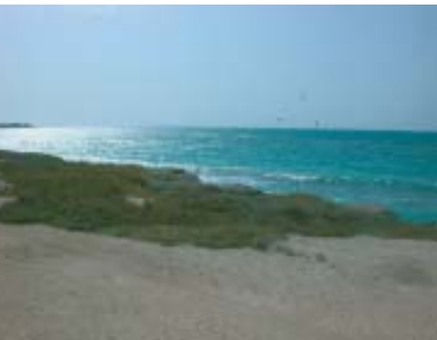
Île de Qarnein

La création de ces zones protégées contribuera de façon significative à la mise en avant du potentiel de protection des espaces forestiers basée sur les communautés autochtones, mécanisme actuellement testé par le WWF-International.