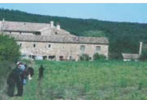
Monastère de Solan

Les futurs projets comprennent une extension de la propriété afin d'assurer une meilleure protection de la forêt, ainsi qu'un projet d'école qui permettra d'apporter une éducation de base aux enfants des populations autochtones voisines, et de mener des programmes d'éducation à l'environnement et de transmission des traditions. Un petit hôpital de forêt est aussi à l'étude, pour soigner les malades locaux qui n'ont pas accès à la médecine occidentale.