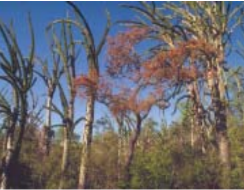
Plateau de Mahafaly