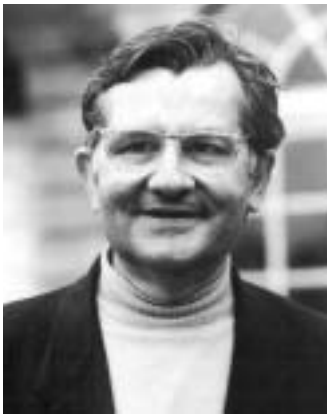
Jean-Marie PELT, Président de l’Institut Européen d’Ecologie, Professeur Emérite de l’Université de Metz

Pour parrainer ces Rencontres, il fallait donc un homme dont la renommée d’écologiste et de naturaliste n’est plus à prouver : Jean-Marie PELT .