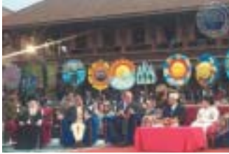
Kathmandou, cérémonie des “Cadeaux Sacrés pour une Planète Vivante”, en présence du Prince Philip, alors Président du WWF-International

En novembre 2000, à Kathmandou, au Népal, des représentants spirituels du monde entier remettaient 26 “Cadeaux sacrés pour une planète Vivante” au cours d’une cérémonie organisée par le WWF et l’A.R.C (Alliance Religion Conservation), montrant ainsi que les religions pouvaient, chacune à leur manière, contribuer concrètement à la protection de l’environnement :