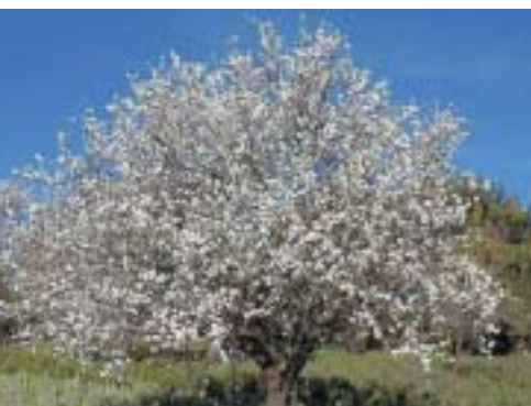
Tou Bishvat, nouvel an des arbres

L'ONG française C.OR.E. (Christian ORganization for Ecology) mène un projet de centre d'écologie chrétien en Sibérie occidentale dans la région d'Omsk. Le milieu rural russe, en grande difficulté sociale et économique est nécessitez d'initiatives propres à le redynamiser. Cela ne doit se faire qu'en tenant compte du milieu naturel : pour cela le centre de la C.OR.E, tout en menant ses activités de sensibilisation des différentes communautés chrétiennes à la protection de la nature, a pour vocation de participer à divers programmes de protection des faune, flore et biotope et de mettre en place des ateliers de production (maraîchage, filature de laine,...) destinés à fournir une activité à la population locale. A échelle réduite, le centre doit intégrer les dimensions spirituelles, sociales et environnementales et témoigner de leur interdépendance.