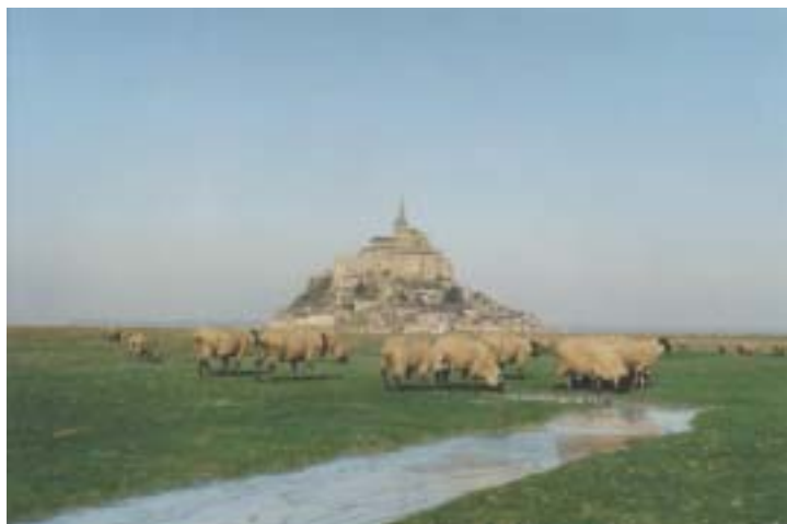
Le Mont-Saint-Michel. Le WWF remercie vivement le Centre des Monuments Nationaux d'accueillir le colloque à l'abbaye du Mont-Saint-Michel

Dès 1874, le caractère historique du monument est reconnu et c'est en 1979 qu'il est inscrit au patrimoine mondial par l'UNESCO. De là-haut tout surprend : le poids de l'histoire, l'architecture, la sérénité, le paysage mouvant, la lumière, la force de la nature.