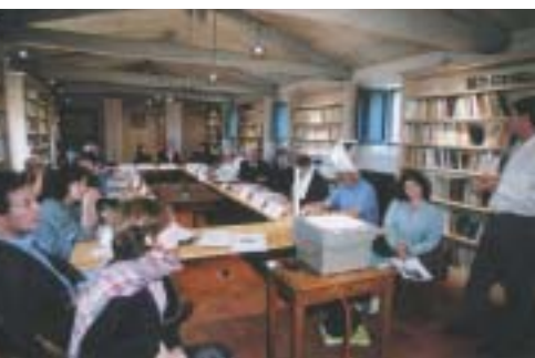
Salle de réunion des Rencontres de Solan

Cette cérémonie était l'aboutissement d'une collaboration que le WWF avait initiée dès 1986, lors du rassemblement inter-religieux d'Assise, en Italie. Le WWF-France a souhaité prolonger cette collaboration dans notre pays, et a organisé une première rencontre inter-religieuse en octobre 2001 au Monastère orthodoxe de Solan, près d'Uzès dans le Gard.