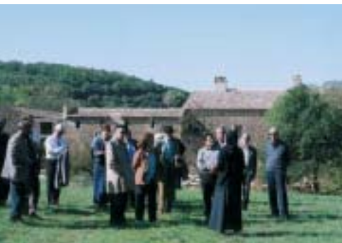
Rencontres de Solan