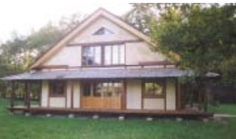
Dojo à la Gendronnière